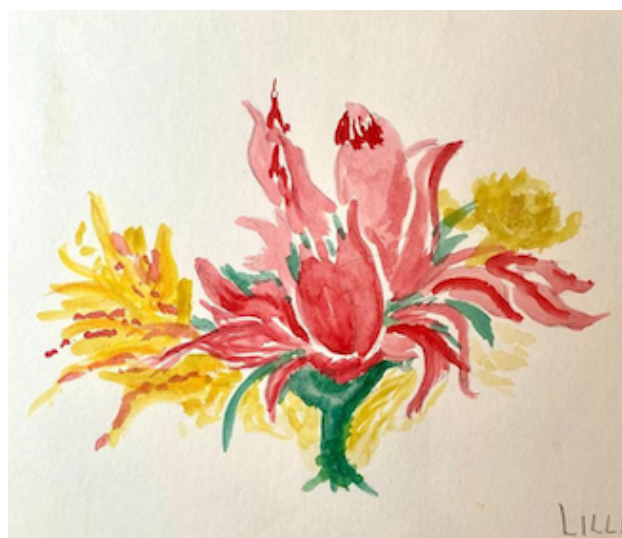
Lilli Fabiani Esuberanza 2026 acquerello 17x25

http://antoniobruni.it/wp- content/uploads/2026/04/Fabiani-L.pdf