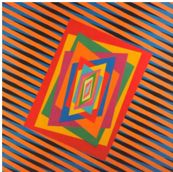
Ferruccio Gard Cinetica