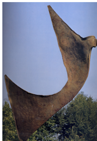
Toni Benetton Deserto

041942111 http://museotonibenetton.it/main/