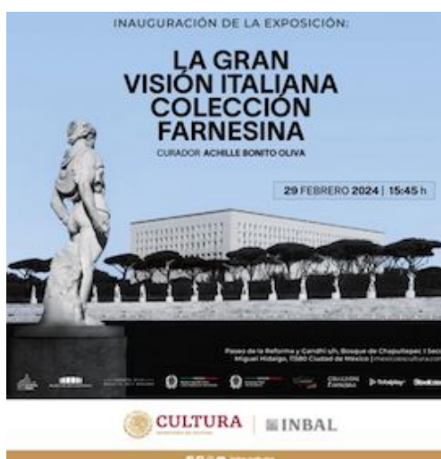
La Collezione d'arte della Farnesina. Mostra a Città del Messico a cura di Achille Bonito Oliva