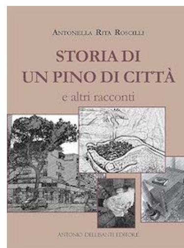
Antonella Rita Roscilli Storia di un pino di città e altri racconti