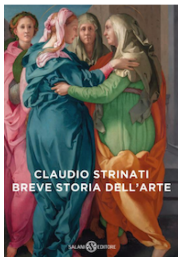
Claudio Strinati Breve storia dell'arte Salani ed.