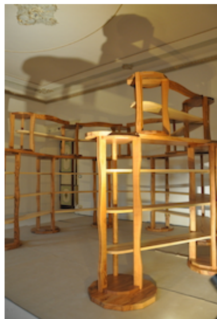
In scena la prima mostra di PANTHEAN, scultura libreria di Antonio Bruni, adattata per la rappresentazione dall'artista Liuba Novozhilova a simboleggiare la casa della vedova.

https://antoniobruni.it/se-una-vedova-in-penombra/